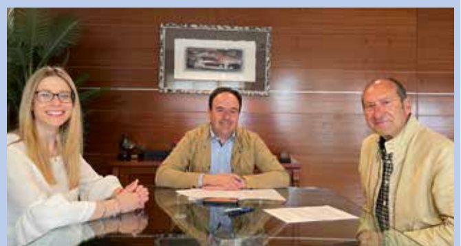
Rondalla Cordes i Veus Font del Molí