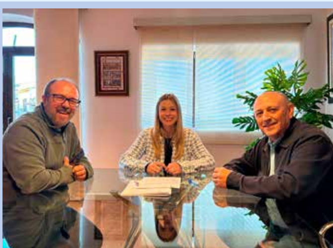
Escola de Música. Centre Musical Puig Campana