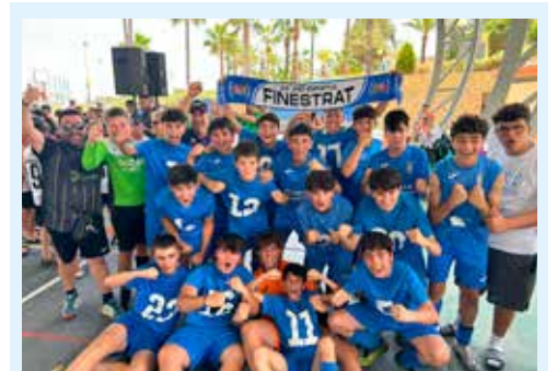
FÚTBOL. Los infantiles de Finestrat, campeones de la Marina Baixa Cup Weekend.