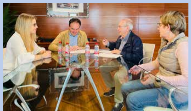
Agrupació Coral de Finestrat