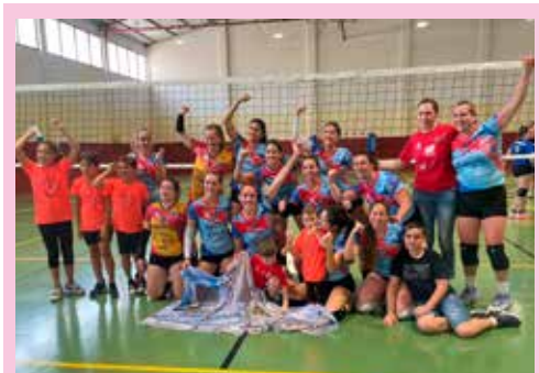
VOLEIBOL. El equipo senior de 2ª división logra el ascenso a Primera Autonómica tras proclamarse campeonas de liga.

DE LOS 10 AÑOS QUE LLEVAS SOBRE LA MOTO CUÁL ES EL MOMENTO MÁS EMOCIONANTE DE TU TRAYECTORIA. El año pasado gané en el Circuito de Jerez el Campeonato de España de Promo3. Fue muy muy emocionante.