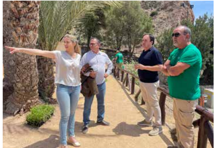
Taller LABORA de Jardinería